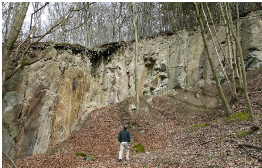
Steinbruch Selberg bei Quiddelbach

Fasziniert Sie Vulkangestein aus dem Quartär und Tertiär oder wandern Sie gerne durch unser idyllisches, devonisches Schiefergrundgebirge? Das Buch bietet Ihnen dazu zahlreiche Vorschläge für schönste Wanderziele in der Eifel. Erkunden Sie Kultur, Geologie und Natur rund um die spannenden Steinbrüche unserer einzigartigen Mittelgebirgslandschaft.